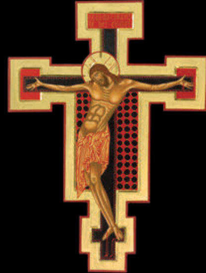
– CROCIFISSO – (59 x 41,7)