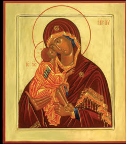
– MADRE DI DIO DEL DON – (39 x 31,5)