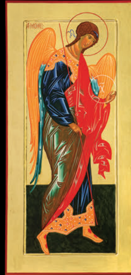
– ARCANGELO MICHELE – (106 x 46)