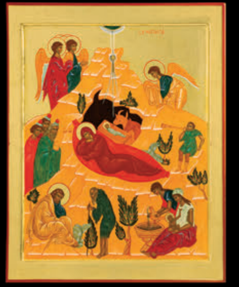
– NATIVITÀ – (55 x 44)