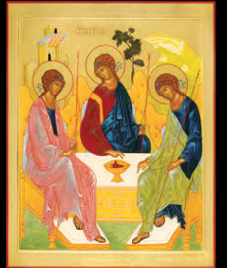
– TRINITÀ – (99,5 x 79,5)