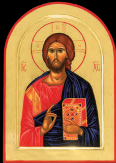
– CRISTO PANTOCRATORE – (39 x 31,5)