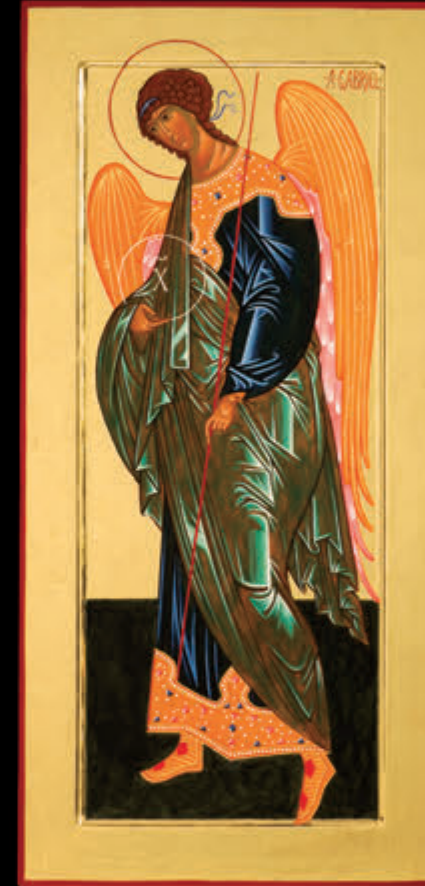
– ARCANGELO GABRIELE – (106 x 46)