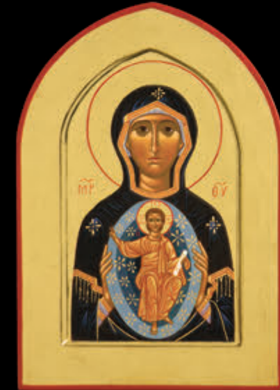
– MADRE DI DIO DEL SEGNO – (37,5 x 26)